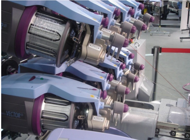
De Attivo rem op de Progress- Vector van LGL Electronics biedt heel wat voordelen, zonder meer plaatst in te nemen.

Op ITMA 2007 toonde LGL ELECTRONICS de nieuwe elektronisch gestuurde inslagrem ATTIVO. Dat ATTIVO het Italiaanse woord is voor ACTIEF is duidelijk, de naam illustreert bovendien zeer duidelijk dat de rem werkelijk als actief element fungeert tijdens de inbrengcyclus van de inslagdraad.